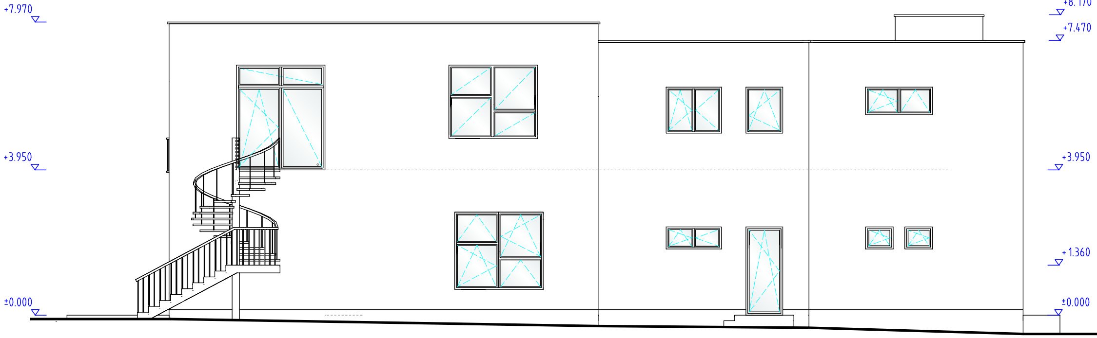
POHLED SEVEROVÝCHODNÍ NOVÝ STAV