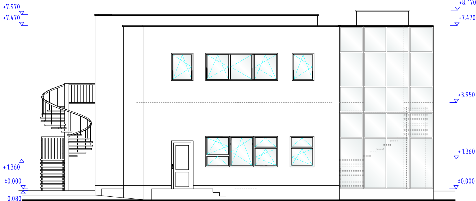
POHLED SEVEROZÁPADNÍ NOVÝ STAV